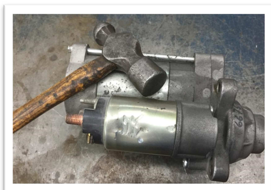
-Unité démontrant des marques de coups