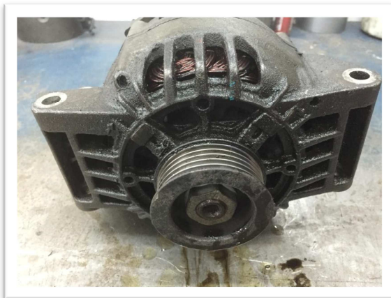
-Unité contaminé par de l'huile ou autre liquide