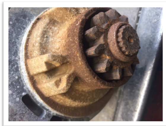
-Signe de corrosion anormal